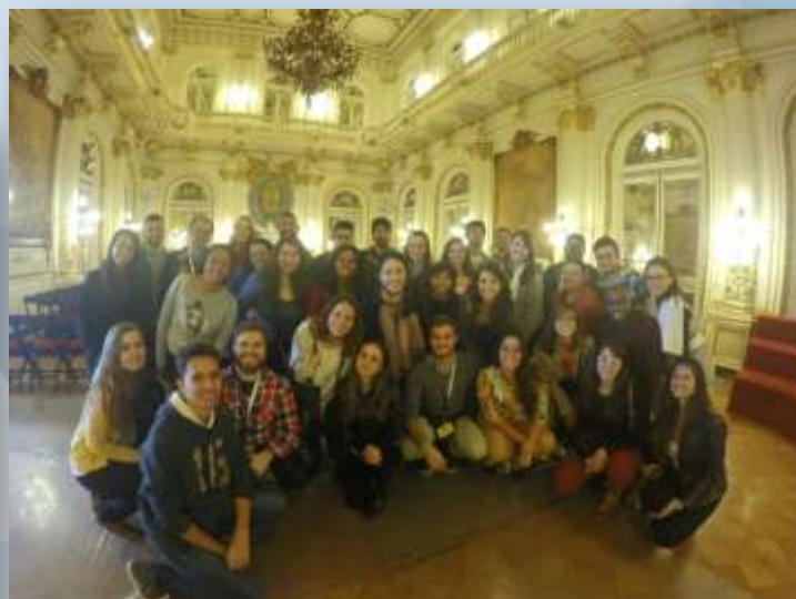
Alunos do BRI da UFABC em intercâmbio a Universidade Nacional de Quilmes - 2015