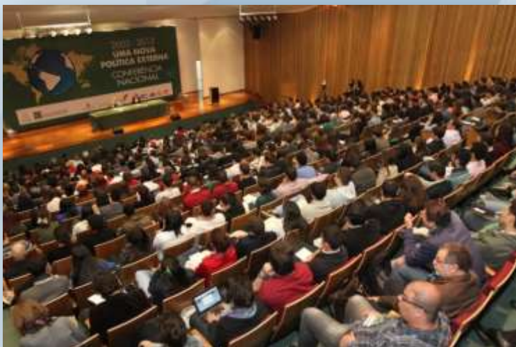
Conferência Nacional 2003-2013: Uma Nova Política Externa